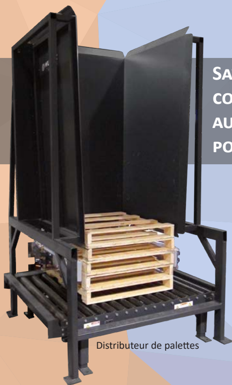
Distributeur de palettes