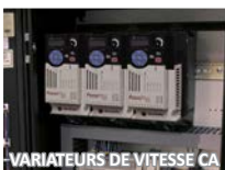
VARIATEURS DE VITESSE CA