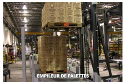
EMPILEUR DE PALETTES