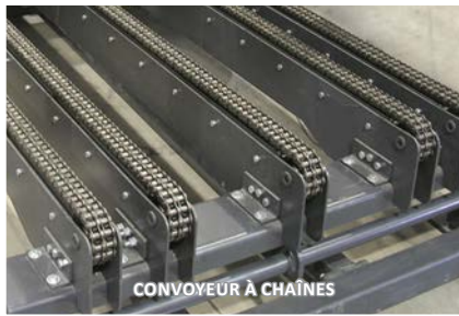
CONVOYEUR À CHÂÎNES