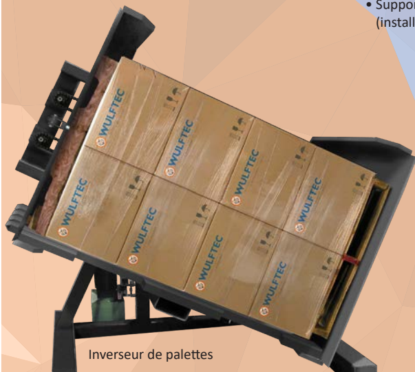
Inverseur de palettes