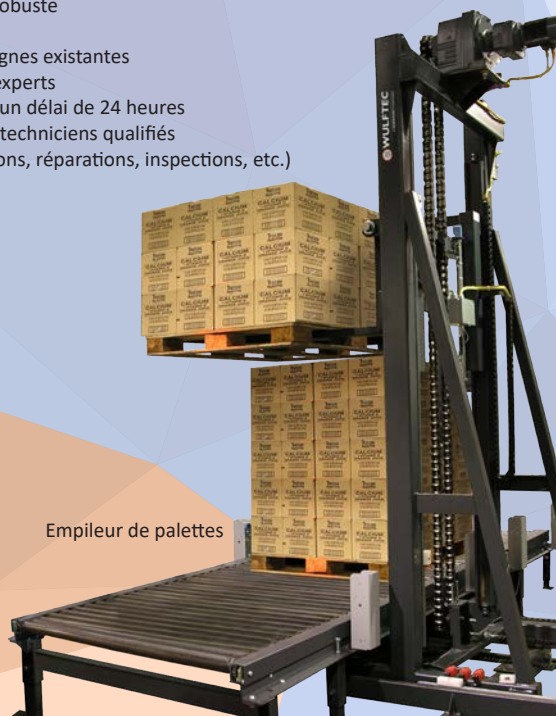
Empileur de palettes