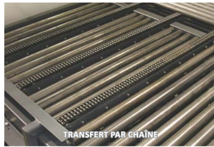
TRANSFERT PAR CHÂÎNE