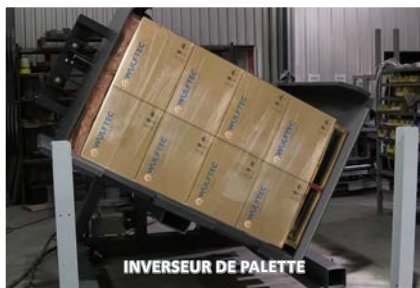
INVERSEUR DE PALETTE