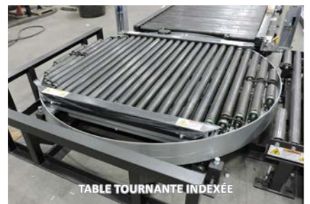
TABLE TOURNANTE INDEXÉE