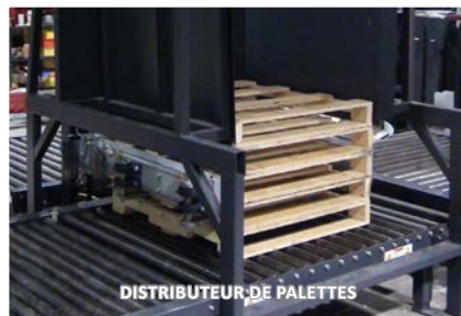
DISTRIBUTEUR DE PALETTES