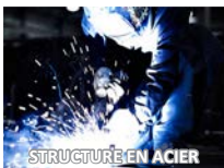
STRUCTURE EN ACIER